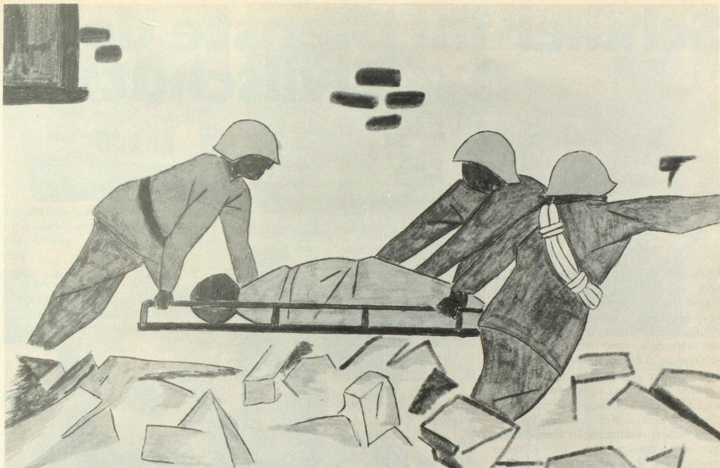
Rey-Mermet Blaise, Monthey, Jahrgang 1963