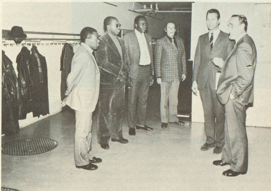
Dans le sous-sol de Berne. Visite, à l'Allmend, du centre de la PC de la ville fédérale. La délégation s'est montrée très impressionnée par cette construction

Le contact avec nos hôtes venus d'Afrique fut des plus agréables et intéressants pour les uns et les autres. L'atmosphère de sympathie qui a présidé aux différents entretiens est née, sans doute, de la vivacité d'esprit et d'intérêt qu'ont témoignée ces représentants d'une jeune nation soucieuse d'assurer sa sécurité dans le monde et, enfin, de l'accueil chaleureux réservé aux visiteurs par les représentants de Fribourg et de Berne.