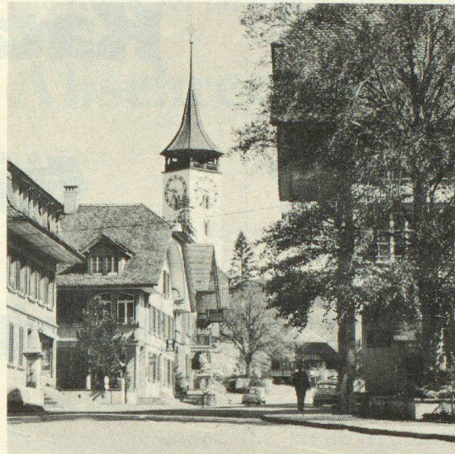
Steffisburg, ein altes währschaftes Berner Dorf, das bevölkerungsmässig eine Kleinstadt geworden ist

Das Tagungsprogramm umfasst eingehende Orientierungen über den Zivil-