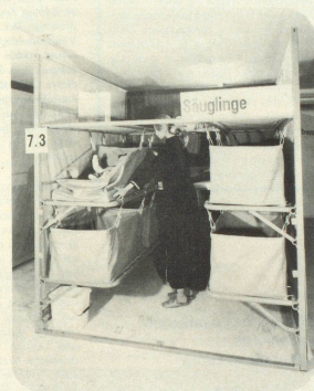
Ablagen für die persönlichen Effekten müssen eingeplant werden