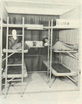
Kranke müssen besonders betreut werden