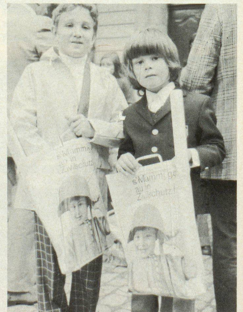
Zwei dankbare zukünftige Zivilschutz-Angehörige!