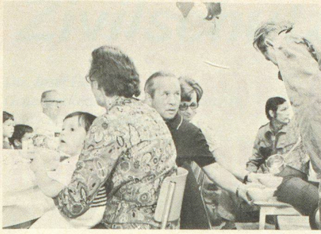
▲ Die Verpflegung im Schutzraum, ein besonderes Problem für sich, das den jeweiligen Örtlichkeiten und Umständen angepasst werden muss

blem, das vordringlich bei der Ausbildung berücksichtigt werden muss. Wir haben schon im letzten Beitrag auf die besonderen Probleme der Alten, der Kranken, der Kinder und Säuglinge hingewiesen, für die zweckmässige Lösungen gefunden werden müssen. Dazu kommen der Wasserhaushalt, die Sanitäreinrichtungen, die Verpflegung und alle jenen kleinen Dinge des täglichen Lebens, an die auch unter der Erde gedacht werden muss und die im Rhythmus des Schutzraumlebens dazu geeignet sind, ohne besonderen Zwang eine bestimmte Ordnung und damit auch Disziplin zu organisieren und zu halten. Im Tagesprogramm eines Schutzraumes, wo die äusseren Einflüsse mit ihren Stress- und Reizanfälligkeiten fehlen, werden gerade diese kleinen Dinge von grösster Bedeutung und zu Fixpunkten eines geordneten Lebens.