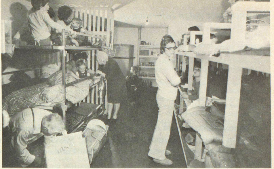
▲ Alte und Junge, Gesunde und Gebrechliche, sie alle müssen im Schutzraum zusammenleben und miteinander auskommen. Jeder sollte sich für jeden verantwortlich fühlen

blem, das vordringlich bei der Ausbildung berücksichtigt werden muss. Wir haben schon im letzten Beitrag auf die besonderen Probleme der Alten, der Kranken, der Kinder und Säuglinge hingewiesen, für die zweckmässige Lösungen gefunden werden müssen. Dazu kommen der Wasserhaushalt, die Sanitäreinrichtungen, die Verpflegung und alle jenen kleinen Dinge des täglichen Lebens, an die auch unter der Erde gedacht werden muss und die im Rhythmus des Schutzraumlebens dazu geeignet sind, ohne besonderen Zwang eine bestimmte Ordnung und damit auch Disziplin zu organisieren und zu halten. Im Tagesprogramm eines Schutzraumes, wo die äusseren Einflüsse mit ihren Stress- und Reizanfälligkeiten fehlen, werden gerade diese kleinen Dinge von grösster Bedeutung und zu Fixpunkten eines geordneten Lebens.