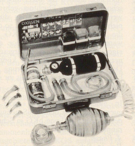
Erste-Hilfe-Koffer Modell Modulaide Oxygen Jet

Mit grosser Genugtuung darf man feststellen, dass die Zusammenarbeit zwischen den beiden Stäben erfreulich gut war.