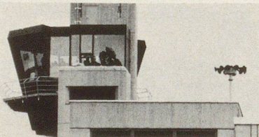
Foto: Neuer Beobachtungsturm Flughafen-Feuerwehr Kloten; rechts davon die Ericsson-Tyfon-Alarmanlage.

sun avaunt maun in grandas massas. Cha ellas nu vegnan in adöver in cas da guerras, es probabel be uschè lönch cha l'üna u l'otra part da quels chi's cumbattan retegna l'adöver da quist'arma scu unica pussibilted per cas d'imbarraz. Dalander essans nus uschè inavaunt cha stuvains integrer tuots lös d'abiter illa protecziun cumplessiva. Las armas tendschan uschè dalöntsch cha eir lur acziun lontaun davent da la Svizra po chaschuner razz radioactivs chi nu's ferman neir brich a nos confin ed eir brich als cunfins cumünels u rivand tar nossas muntagnas. In quist cas vainsa da fügir in noss locals da protecziun e da rester lo uschè lönch fin cha'l prieveel es passo. Quist po dürer tuot seguond fin a 15 dis. Per proteger a minchün stuvainsa fabricher eir illas vschinaunchas las pü pitschnas lös da protecziun, siand eir la populaziun da quels lös degna da protecziun scu quella da vschinaunchas pü grandas e da citeds. Quist fat motivescha cha s'obliescha a mincha lö da's proveder cun locals da protecziun. (Protr.)