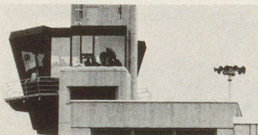
Foto: Neuer Beobachtungsturm Flughafen-Feuerwehr Kloten; rechts davon die Ericsson-Tyfon-Alarmanlage.

sun avaunt maun in grandas massas. Cha ellas nu vegnan in adöver in cas da guerras, es prubabel be uschè lönch cha l'üna u l'otra part da quels chi's cumbattan retegna l'adöver da quist'arma scu unica pussibilted per cas d'imbarraz. Dalander essans nus uschè inavaunt cha stuvains integrer tuots lös d'abiter illa protecziun cumplessiva. Las armas tendschan uschè dalöntscha cha eir lur acziun lontaun davent da la Svizra po chaschuner razz radioactivs chi nu's ferman neir brich a nos confin ed eir brich als confin cumünels u rivand tar nossas muntagnas. In quist cas vainsa da fügir in noss locals da protecziun e da rester lo uschè lönch fin cha'l prieveel es passo. Quist po dürer tuot seguond fin a 15 dis. Per proteger a minchün stuvainsa fabricher eir illas vschinaunchas las pü pitschnas lös da protecziun, siand eir la populaziun da quels lös degna da protecziun scu quella da vschinaunchas pü grandas e da citeds. Quist fat motivescha cha s'obliescha a mincha lö da's proveder cun locals da protecziun. (Protr.)