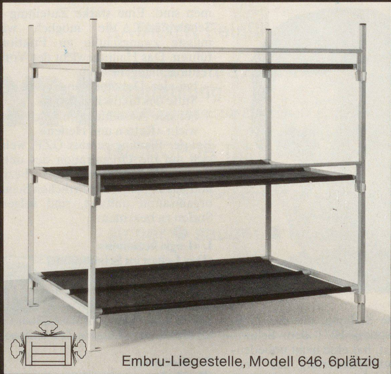
Embru-Liegestelle, Modell 646, 6plätzig

Embru ist Generalunternehmer für die Lieferung von über 20000 Liegestellen, samt Einrichtung der notwendigen Zusatzräume, wie Block-Leitungen, Quartier-Leitungen, Toilettenanlagen usw.