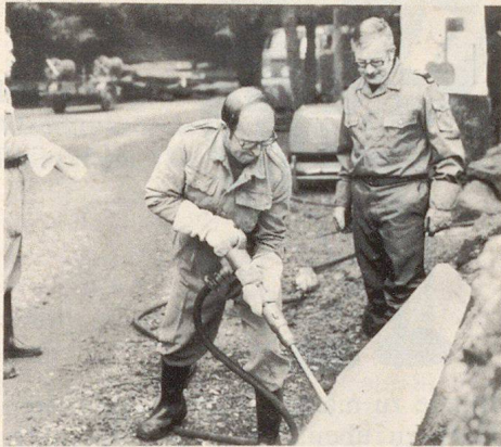
Bundesrat Dr. Kurt Furgler am Bohrhammer