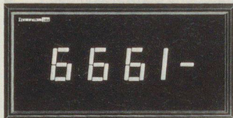
Neue Familie digitaler Anzeigegeräte

Metrawatt ergänzt sein Programm durch eine neue Familie digitaler Anzeigegeräte zum Einbau in Schalttafeln. Die Gerätetypen, die wahlweise im Format 96 x 48 oder 96 x 26 mm verfügbar sind, unterscheiden sich vor allem durch die Anzahl der Messpunkte. Beim Messverfahren wird das