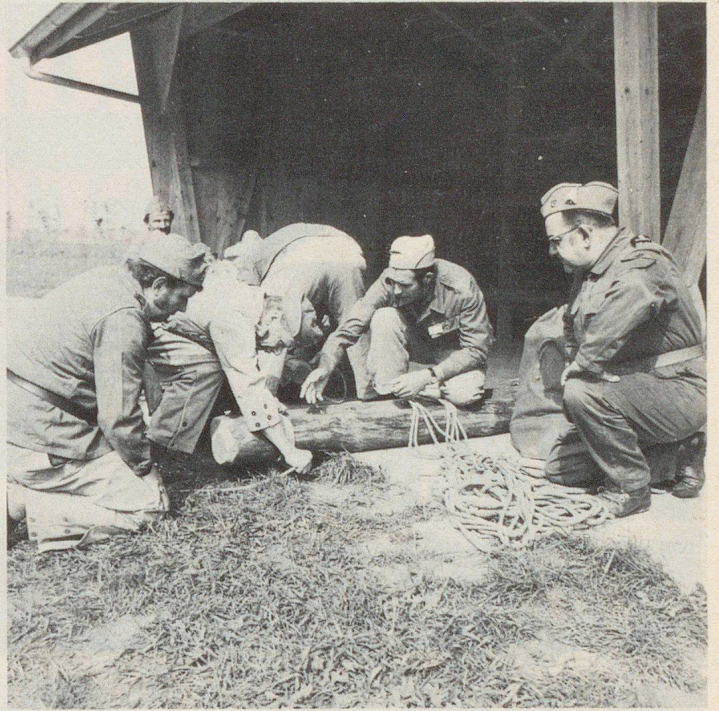
Feuerwehrmann der Bundesstadt als Klassenlehrer im Zivilschutz.