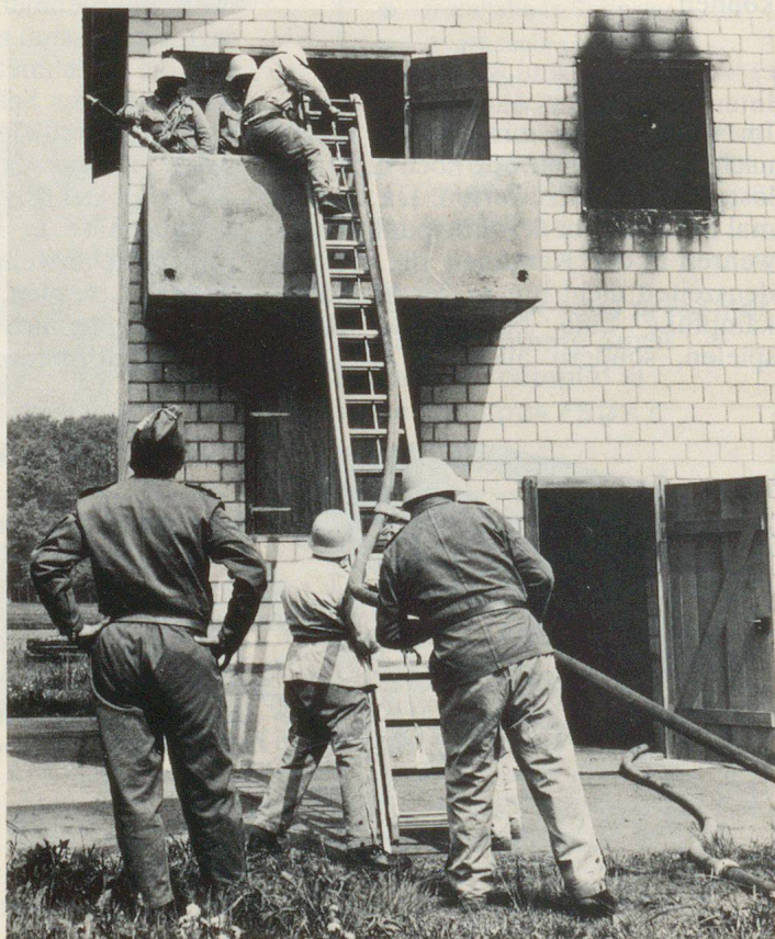
Klassenarbeit im Brandhaus unter Leitung eines Feuerwehrinstructors.