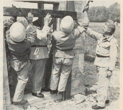
Feuerwehrmann der Bundesstadt als Klassenlehrer im Zivilschutz.