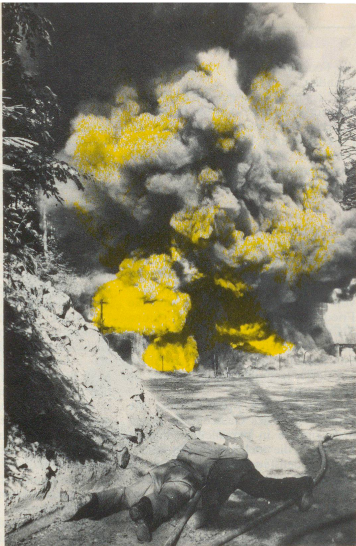
Bekämpfung eines Benzinbrandes von 6000 Litern in Berr