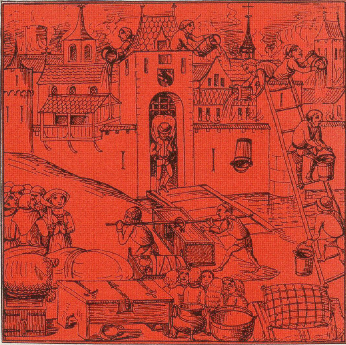
Der Stadbrand von Bern 1405, Rettungs- und Löscharbeiten.