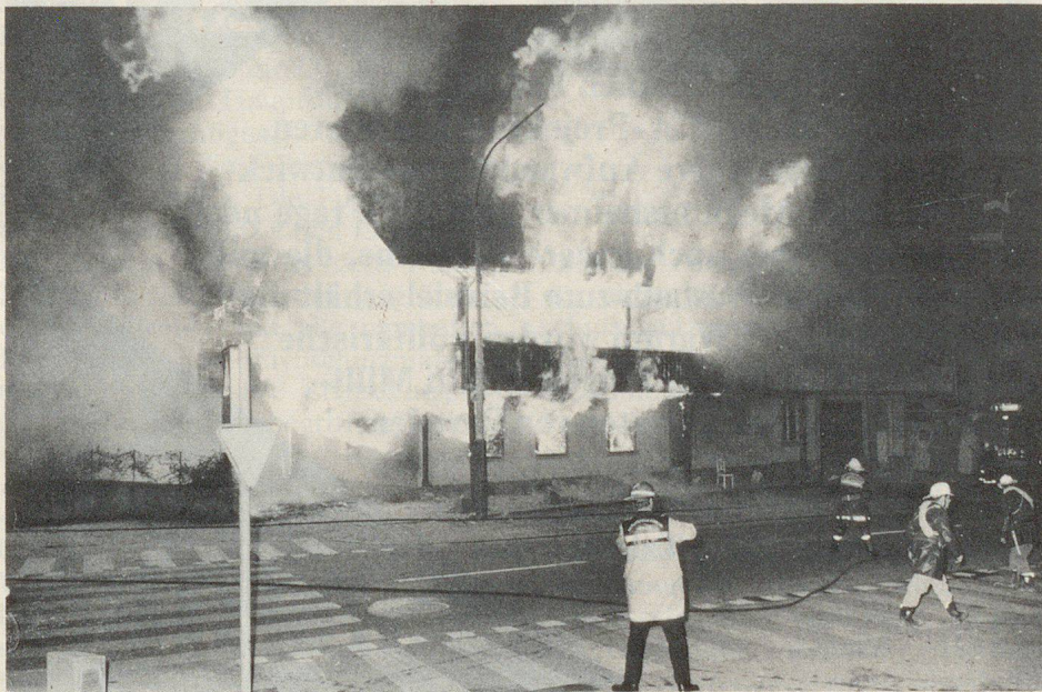
Feuerwehr der Stadt Bern im Grosseinsatz in Ostermundigen.