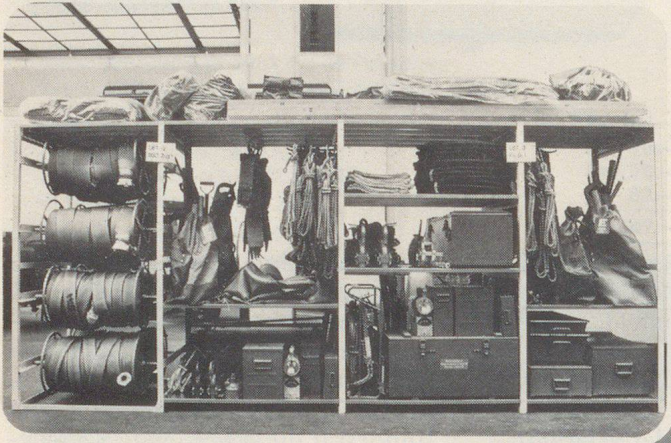
Schränke, Effekten- und Materialgestelle Kombi-Betten als Liege- und Lagergestelle