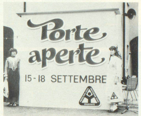
Due graziose ragazze in costume ticinese davanti al grande cartellone pubblicitario della protezione civile.