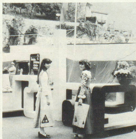
I colori giallo-nero della protezione civile hanno fatto bella mostra sia nell'artistica composizione che nei sacchetti in plastica con il materiale didattico distribuito ai 1500 scolari delle scuole medie bellinzone. Due graziose fanciulle in costume davanti alla scultura con i sacchetti della protezione civile. Sullo sfondo le torri delle murate dei castelli di Bellinzona.