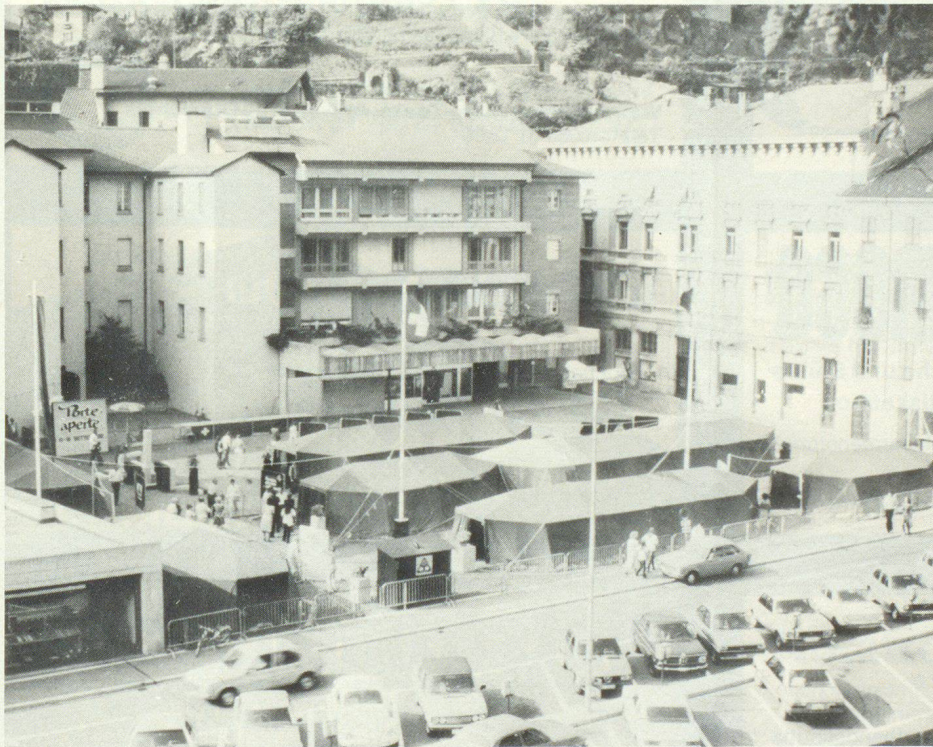
Visione generale alla Cervia di Bellinzona dell'esposizione «Porte aperte della protezione civile» visitata da circa 8000 persone.