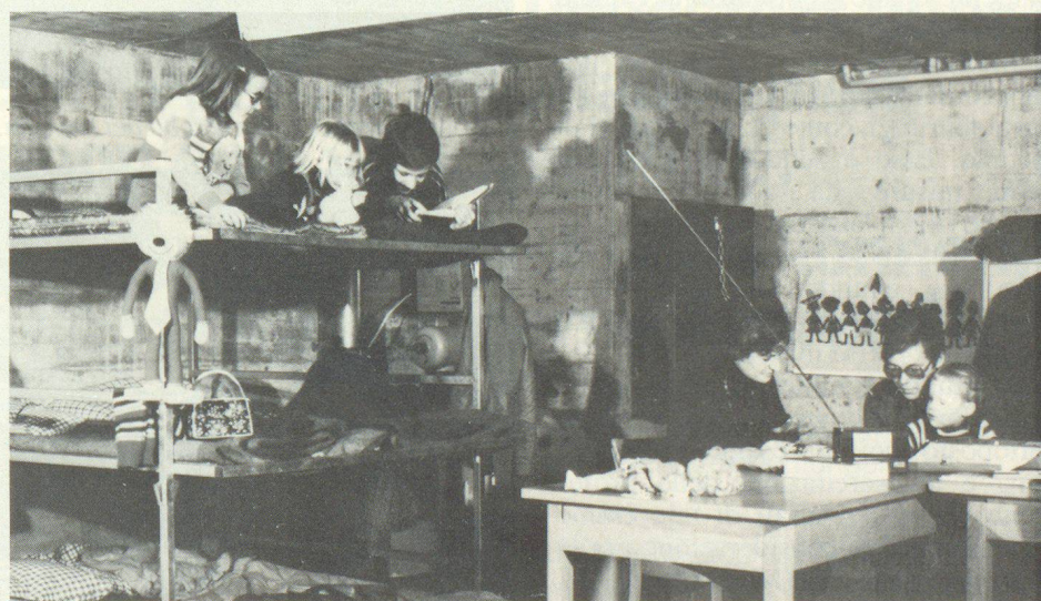
Exemple d'un abri équipé de dortoirs préfabriqués qui peuvent être acquis dans diverses firmes suisses.