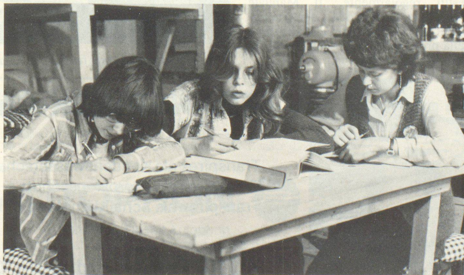
Vivendo nel rifugio è molto importante preoccuparsi di come far occupare il tempo ai giovani e agli anziani.