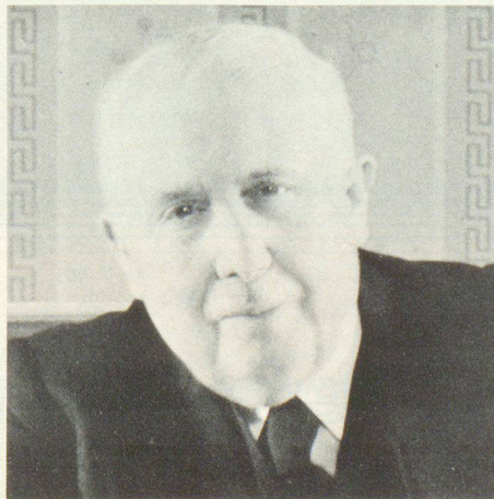
Alt Bundesrat von Steiger, der erste verdiente Zentralpräsident des Schweizerischen Bundes für Zivilschutz, der vor allem durch seine reichen Erfahrungen und Beziehungen viel zu Erstarbung des jungen Bundes beitrug.