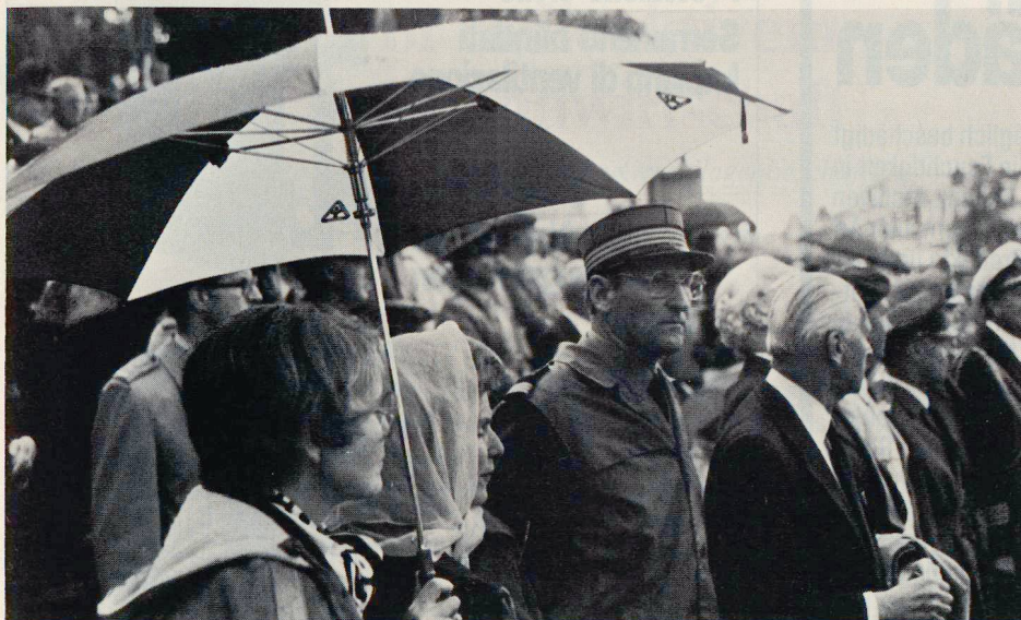
Unter dem Schutz des ZS-Schirmes