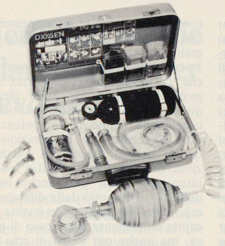
Erste-Hilfe-Koffer Modell Modulaide Oxygen Jet