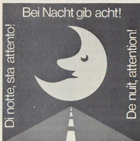
Motto 1980 des Verkehrserziehungsprogramms der Armee