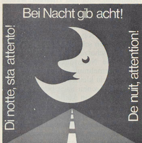
Motto 1980 des Verkehrserziehungsprogramms der Armee