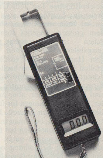
Digitaler Zangenstrommesser DZA 1000 mit speicherbarer Anzeige.

Ein besonderer Vorteil dieser Messzange liegt in der Speichereinrichtung, die durch Drücken einer