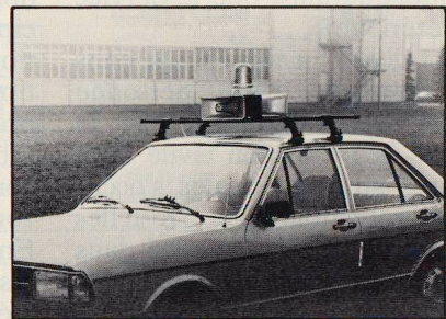
Alarmeinheit für den mobilen Einsatz Mit 2 oder 4 Lautsprechern, mit oder ohne Blaulicht, für 4 verschiedene Alarmsignale und Sprachdurchsage, für Kernkraftwerke, Zivilschutz, Feuerwehr, Polizei und Armee.

Ericsson Alarmsysteme: 20 Jahre Erfahrung für die Sicherheit