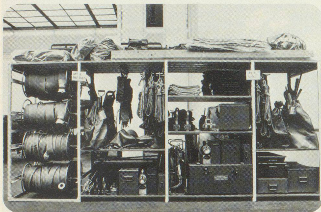
Schränke, Effekten- und Materialgestelle Kombi-Betten als Liege- und Lagergestelle