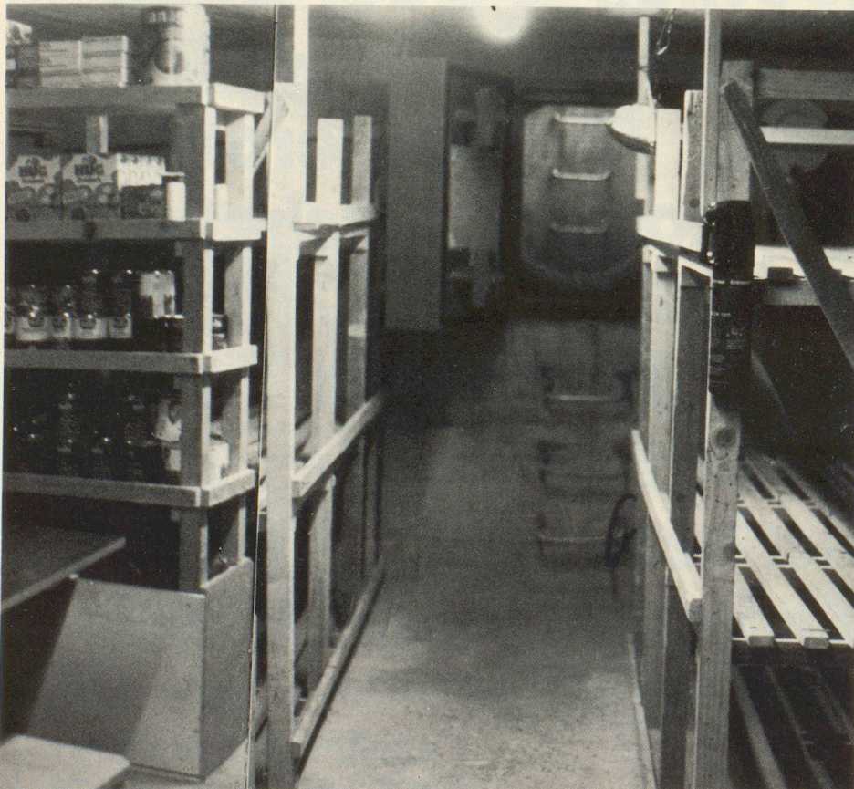
Das Zentrum verfügt auch über einen Übungsschutzraum, in dem auch der Hinweis auf den Überlebensvorrat nicht vergessen wurde.