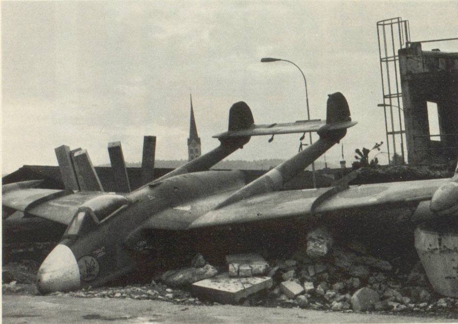
Blick über einen Teil der Übungspiste mit einem der beiden Flugzeuge.