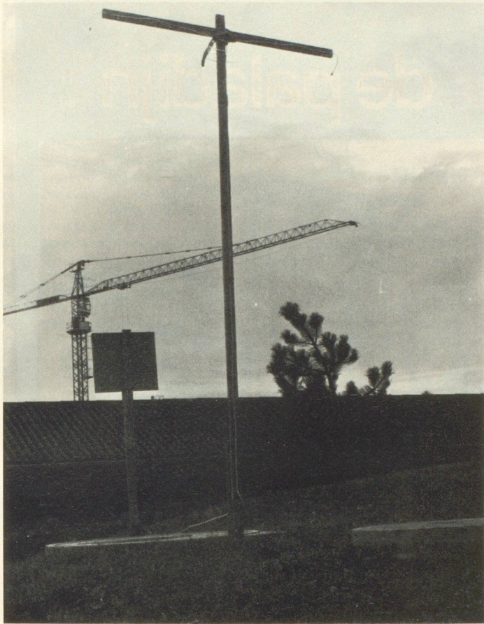
Über dem Schutzraum die laut Schutzraumhandbuch gefertigte Antenne für den sicheren Radioempfang.