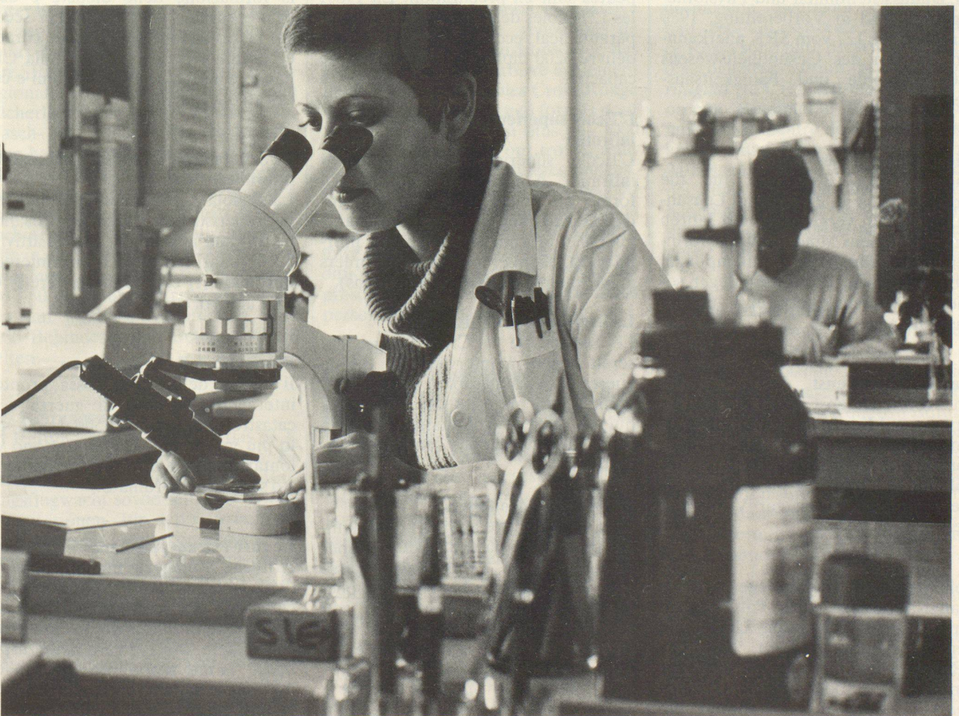
Il Servizio di trasfusione del sangue