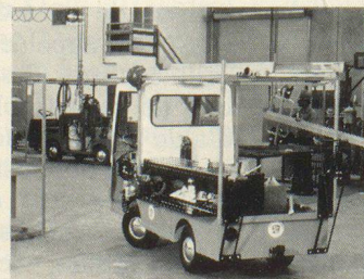
Ein Elektrofahrzeug einmal anders – als Servicewagen.

Mit der Einführung der Taylor-Dunn-Elektrofahrzeuge bringt die T-D Elektro-Fahrzeuge AG, Payerne, ein Produkt auf den Markt, das in dieser Sparte einige neue Akzente setzen wird. Wie bekannt, sind Elektrofahrzeuge ideal für interne Transporte in Industrie, Handel und Verwaltung. Wirtschaftlich, effizient und umweltfreundlich – aber teuer in der Anschaffung. Diese Situation hat sich jetzt, dank der Herstellung in grossen Serien, geändert. Taylor-Dunn, ein amerikanisches Unternehmen, ist seit über 30 Jahren führend in der Herstellung von Elektrofahrzeugen für professionelle Transporte von Personen und Waren. Mit bereits mehreren Zehntausenden Elektrofahrzeugen in Betrieb in der Industrie kann man Taylor-Dunn sicher als einen der erfahrensten Produzenten in dieser Branche betrachten. Die T-D Elektro-Fahrzeuge AG, mit Hauptsitz in Payerne, hat sich nun zum Ziel gesetzt, die preisgün-