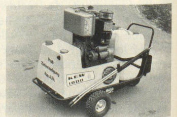
K.E.W.-Hochdruckreiniger Typ CD 150 mit Dieselmotor und Batteriestarter, 6-Zylinder-Hochdruckpumpe mit einer Ausgangsleistung von 4,1 kW (150 bar bei 16,4 l/min), Ersatzhochdruckschlauch, Saugschlauch mit Spezialfilter usw. Kosten: etwa 9000 Franken.

Weitsichtige Fachleute haben dies erkannt und rüsten Ausbildungszentren des Zivilschutzes und auch die grösseren Schutzanlagen sukzessive mit Hochdruckreinigern aus. Besonders empfehlenswert sind benzin- oder dieselbetriebene Gerätetypen mit stufenloser Mengene- und Druckregulierung, damit diese überall und jederzeit unabhängig vom Stromnetz eingesetzt werden können.