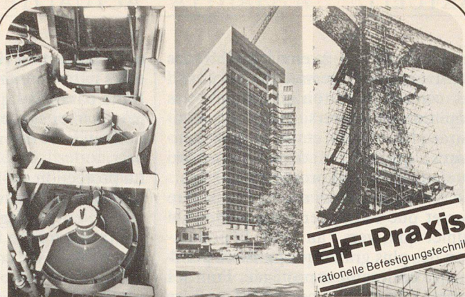
Schwerstbefestigungen Fassadenverkleidungen Betonverbindungen

Beschlägefabrikation Wilerweg 37, Telefon (062) 21 40 03