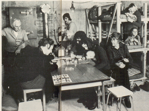
Zivilschutz 7/8 83

Unentbehrlich für den Fall der Fälle ist die Radioversorgung in der Zivilschutzanlage. La radio, c'est important sous la terre.