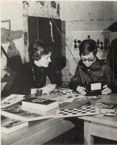
Zivilschutz 7/8 83

Des moyens d'information disponibles, la presse, la radio et la télévision, seule la radio est en mesure de remplir les conditions mentionnées. Elle seule permet d'atteindre en temps utile tous les milieux intéressés, de les informer, de les mettre en garde contre les dangers qui les menacent et de leur communiquer les instructions et directives nécessaires. La presse ne fonctionne pas faute de temps, non plus