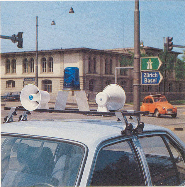
Großer Dachträger DT-11