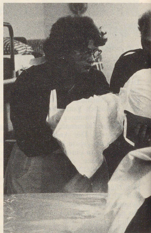
Es braucht viele Hände, um einen Schwere

Übungsschluss erfolgte, musste die Übungszeit (auf dem Papier) um vier Stunden verlängert werden.