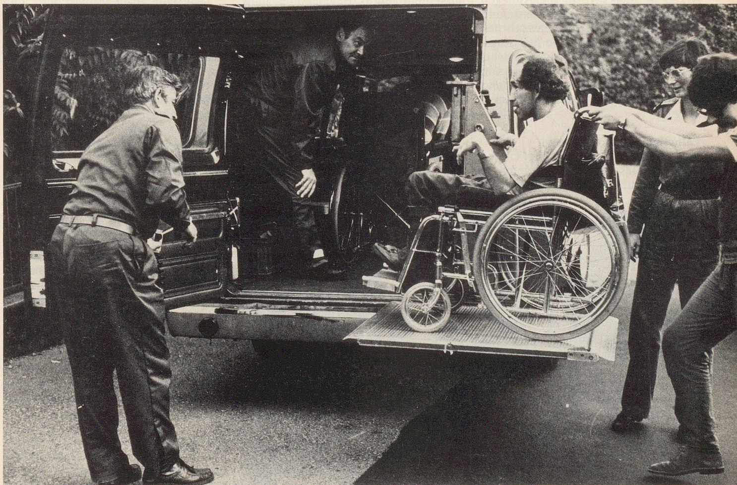
Unsere Patienten sind eingetroffen. Bevor der Trägerzug der Sanitätshilfsstelle alarmiert wird, werden die Schwerstbehinderten in ein Verletztennest umgelagert.

Die Tagwache war auf 05.30 Uhr angesetzt, galt es doch, die Patienten, die teilweise eine intensive Betreuung beanspruchten, vor dem Retablieren