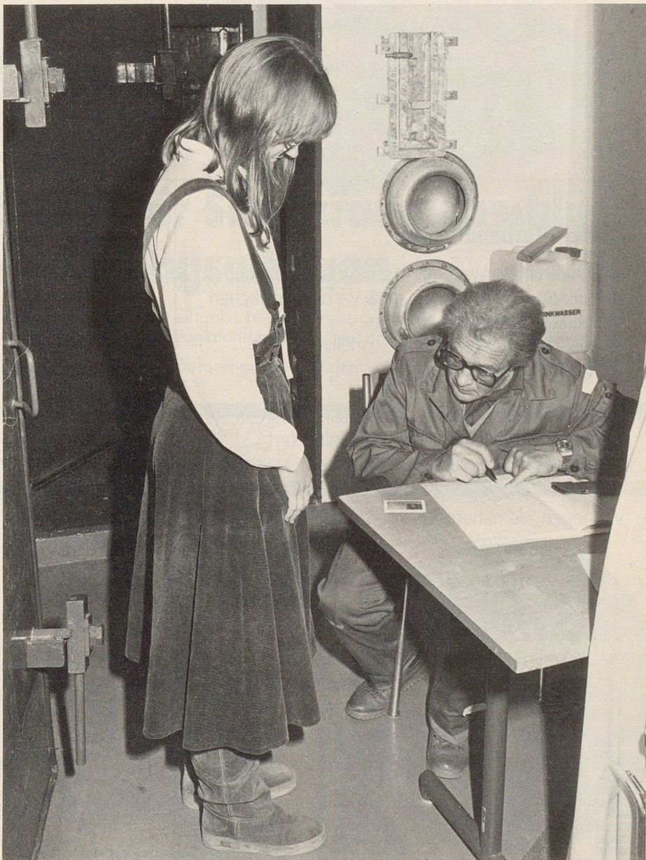
Zutrittskontrolle an der Pforte des Kommandopostens

In der Nacht vom zweiten auf den dritten Tag sah die Übungsanlage einen Zeitsprung von sieben Tagen vor. Dieser musste über die Tagwache hinaus verschoben werden, weil einige Arbeiten vom Vortag her noch nicht abgeschlossen waren. Die etwas abrupte Umstellung auf ein späteres Datum bereitete zahlreichen Übungsteilnehmern Schwierigkeiten; man schrieb nun plötzlich den 10. November, obschon man eben noch ganz im 3. November gelebt hatte, und konnte sich nicht ohne Mühe vorstellen, was sich in der übersprungenen Woche ereignet hatte. Immerhin gab der Übungsleiter eine schriftliche Schilderung der neuen Lage ab, die sich folgendermassen präsentierte: GELB löste vor vier Tagen einen Zangenan-