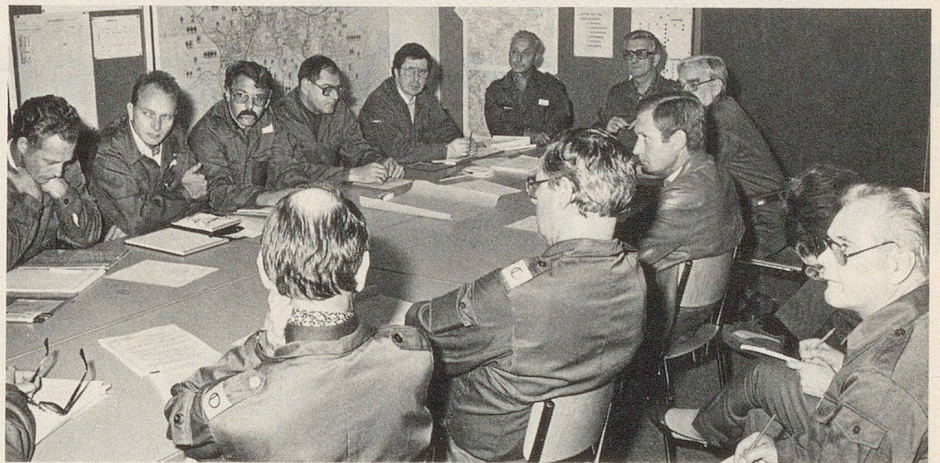
Rapport der Ortsleitung und der Sektorchefs mit einem Mitglied des Stadtrates

diesen Dienstanlass mit Sicherheit nicht in so konzentrierter Form zu erfassen gewesen wären. Lehrstück oder Examen? – Die Stabsrahmenübung war beides in hohem Masse, nicht allein für den beübten Verband, sondern auch für die Übungsleitung. Es bleibt zu hoffen, dieser kurze Bericht trage Früchte und ermutige eine möglichst grosse Zahl Verantwortlicher im Zivilschutz-Vollzug, sich der Stabsrahmenübung als einer hervorragenden Methode praxisbezogener, auf den Ernstfall ausgegerichteter Ausbildung zu bedienen.