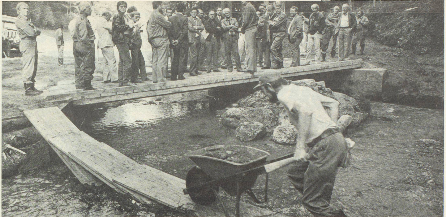
Engagement de la protection civile de la ville de Berne à Schwarzenbourg: un membre de la protection civile continue à travailler opiniâtement pendant que des personnalités soumettent le pont nouvellement construit à un essai de charge.

théorie d'engagement élaborée en une année et demie, les casques jaunes ont fourni un volume de travail de 200 000 francs environ. Les 100 habitants de Saxeten, qui ne peuvent compter qu'avec un rendement fiscal de 50 000 francs par année, leur ont été très reconnaissants du travail accompli. La troupe a dû, jour après jour, faire des trajets de quatre heures aller et retour sur des chemins pénibles. Les membres de la protection civile étaient cantonnés à Wilderswil, d'où ils étaient transportés par véhicules militaires à Saxeten. Depuis là ils devaient se rendre à pied jusqu'aux emplacements des chantiers.