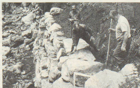
Consolidation du lit d'un ruisseau dans la commune de Saxeten (100 habitants), près d'Interlaken: les hommes de la protection civile de Muri BE empilent des pierres les unes sur les autres afin que le ruisseau soit dompté pour toujours.