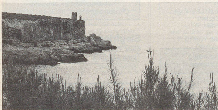
Verträumte Buchten, menschenleere Strände; auch das kann Mallorca sein. Man muss es nur suchen...

Bucht nur ein paar «Mietvelominuten» vom Hotelzimmer entfernt. Abseits der eigentlichen Touristik-Hochburgen leben rund 430 000 Einheimische auf der spanischen «Mittelmeer-Perle», die übrigens kein reines Spanisch, sondern eine eigene, aus dem Katalanischen entwickelte Sprache reden. Abseits der eigentlichen Touristik-Szene, vor allem im Norden und Osten der In-