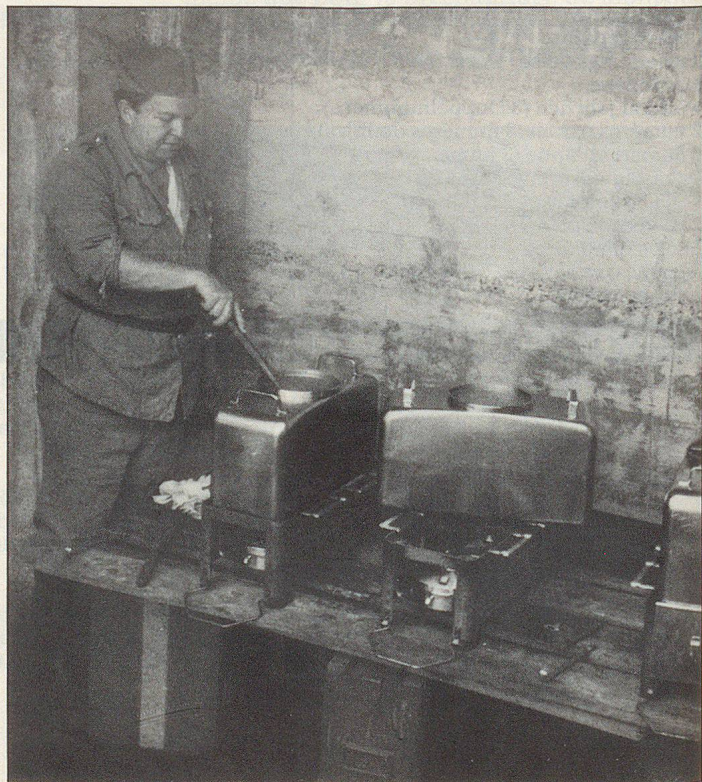
Kochen im Unterstand Cuire dans un abri de sécurité Cuocere in un rifugio

■ Senden an / A renvoyer à: Verkaufsbüro: Firestar AG/SA Postfach, CP 3363 CH-4002 Basel Tel. 061/30 35 75, Telex 63 631