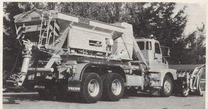
6-m 3 -Aufsatzzstreueautomat mit Feuchtsalzeinrichtung. Abrollkipper-System. Autobahnschneepflug Typ MF mit Windleitschirm.

Bei diesen Strassenzuständen werden durch Windeinflüsse und eigenen Windsog des Streufahrzeuges Verwehungen und Verwirbelungen des Salzes hervorgerufen. Zusätzlich können weitere Wehverluste zwischen dem