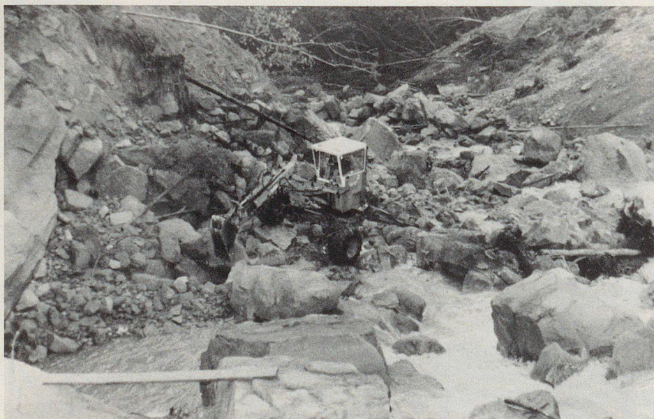
Ein Bagger räumt gesprengte Blöcke weg.

gemacht werden. Die dritte Gruppe sorgte mit ebensolchen Drahtschotterkörben dafür, dass beim Hirsiggraben die Böschungen nicht weiter einstürzen konnten. Ein Holzverbau an der vierten Arbeitsstelle diente demselben Zweck.