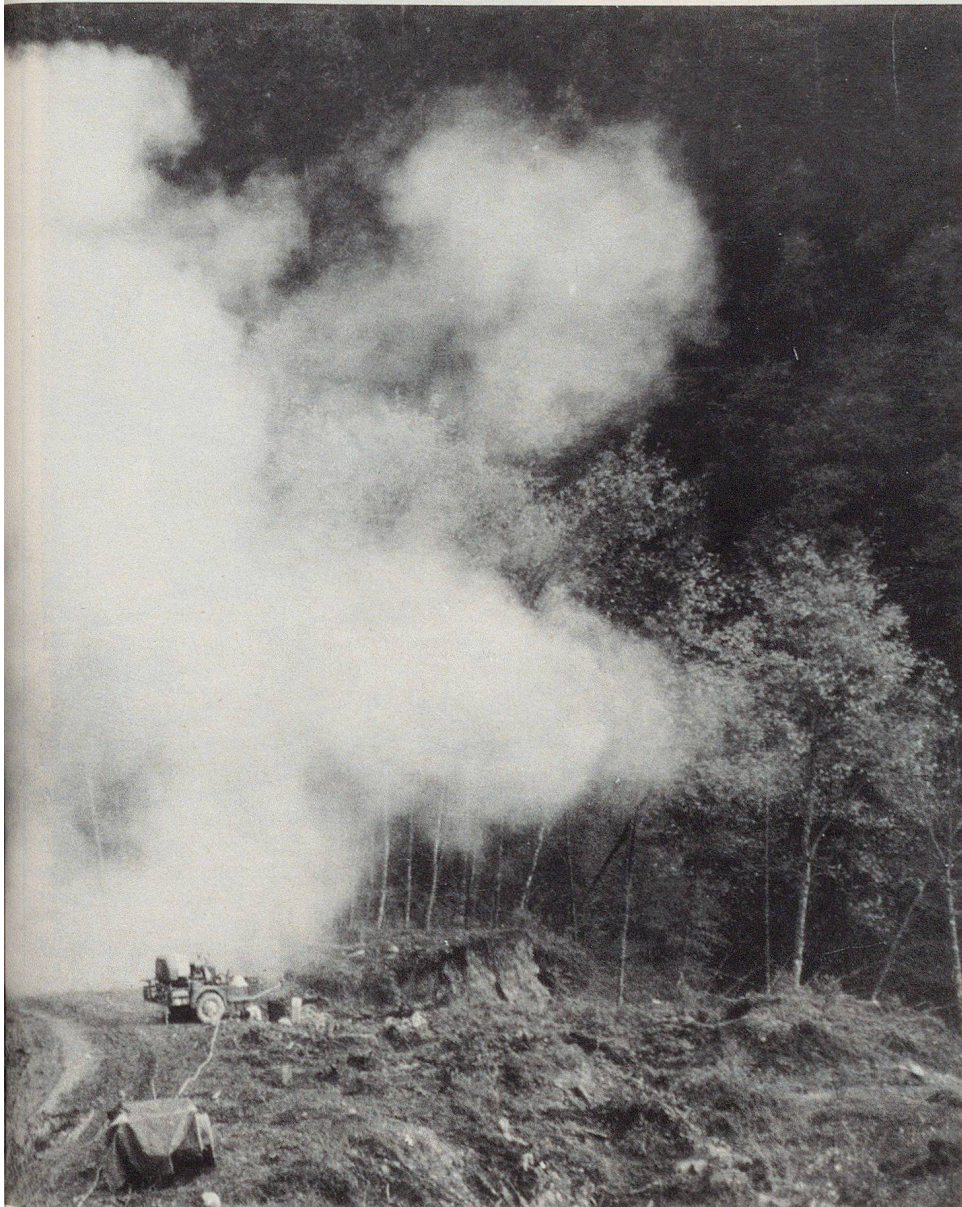
Soeben erfolgte eine Sprengung von wegversperrenden Felsbrocken.