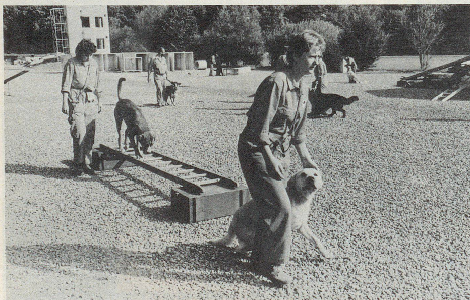
Pas facile, les échelles!

Suite à l'accueil très favorable rencontré par ces manifestations, les responsables du CRIE ont décidé de poursuivre cette expérience. Ils espèrent par ailleurs que les communes reprendront à leur compte ce type de visites au niveau des mesures et des installations PCi propres à chaque ville ou village. ▀