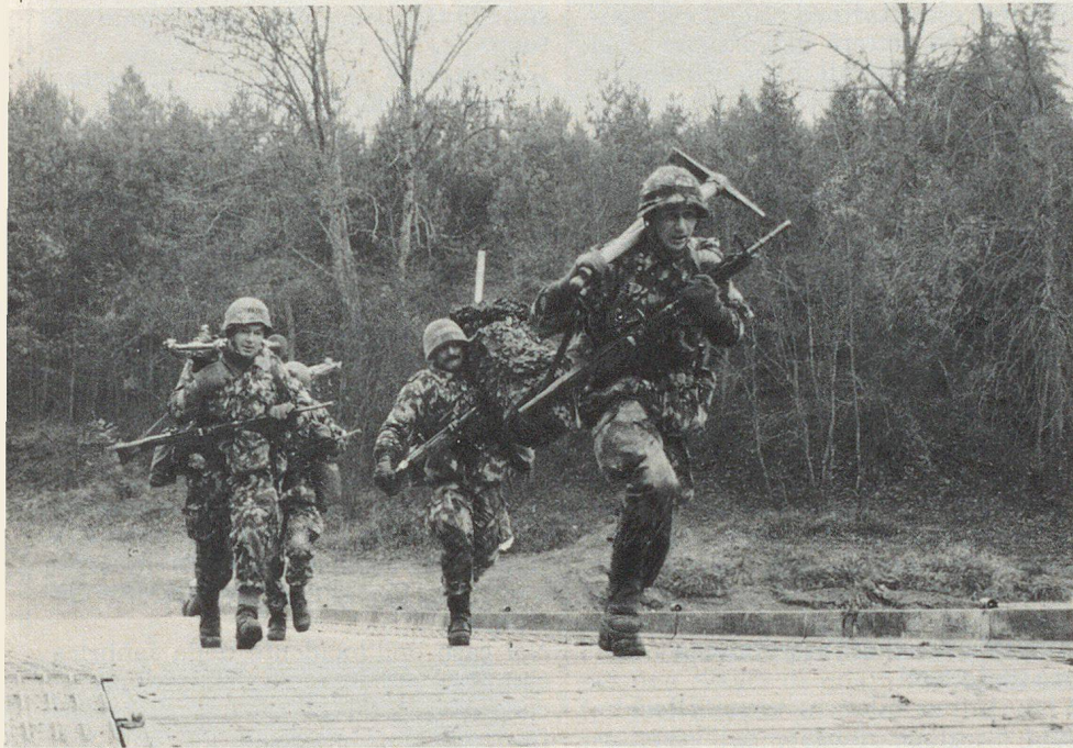
Al seguito dell'esercitazione di difesa integrata «Dreizack» – una relazione, completata da pareri, commenti e prese di posizione