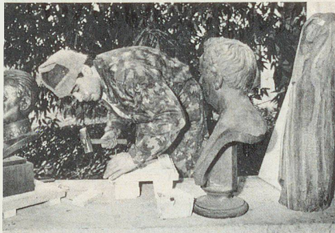
Nella città di Sciaffusa e nel convento di Rheinau si sono svolte, nell'ambito del «Tridente», esercitazioni pratiche di protezione dei beni culturali mobili e trasportabili. L'attuabilità è stata dimostrata, anche se in molti luoghi non è ancora risolta la questione dell'ubicazione. Tuttavia, secondo il parere dei sindaci delle città e dei comuni, irrisolta è ancora la questione della protezione dei beni culturali immobili.

civile dell'esercitazione occorre porre mano prioritariamente al rafforzamento dell'istruzione dei quadri medi nei settori tattica e tecnica del comando nella PC, onde permettere di far fronte alle situazioni che possono presentarsi sulle piazze di sinistri gravi. Occorre in tale ottica prestare particolare attenzione a un chiaro ordinamento del comando in situazioni alterne, così ritengono i consiglieri di Stato Ernst Rüesch (San Gallo) e Alfred Gilgen (Zurigo) nel loro rapporto finale. In pari tempo, i due direttori dell'istruzione pubblica, sulla base dell'arte d'arrangiarsi che hanno potuto rilevare sul campo tra gli addetti della PC, raccomandano di raccogliere, valutare e rendere accessibili in documenti adeguati le molteplici idee di cui sono stati spettatori. WM ▲