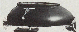
Einsatz im Katastrophengebiet / Intervention dans la région de sinistre