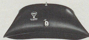
Wasserversorgung Ravitaillement en eau