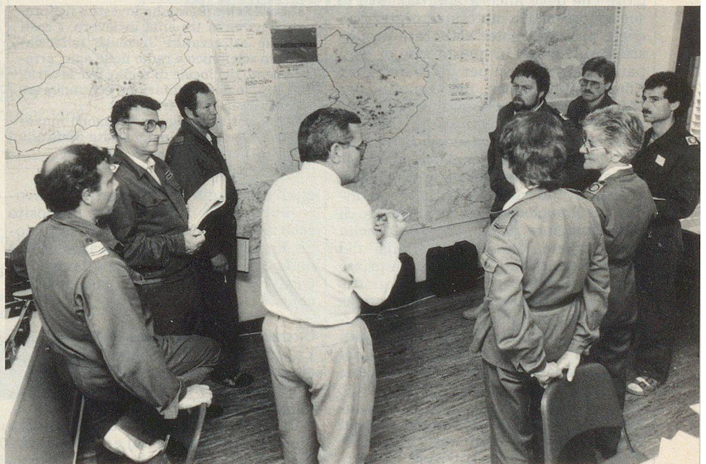
Sostegno dello stato maggiore. Il successo del corso dipende dell'assistente di stato maggiore.

In primo piano sia a Lyss sia a Schwarzenburg sta il lavoro di stato maggiore. Gli obiettivi del corso organizzato dal Cantone di Berna sono identici a quelli