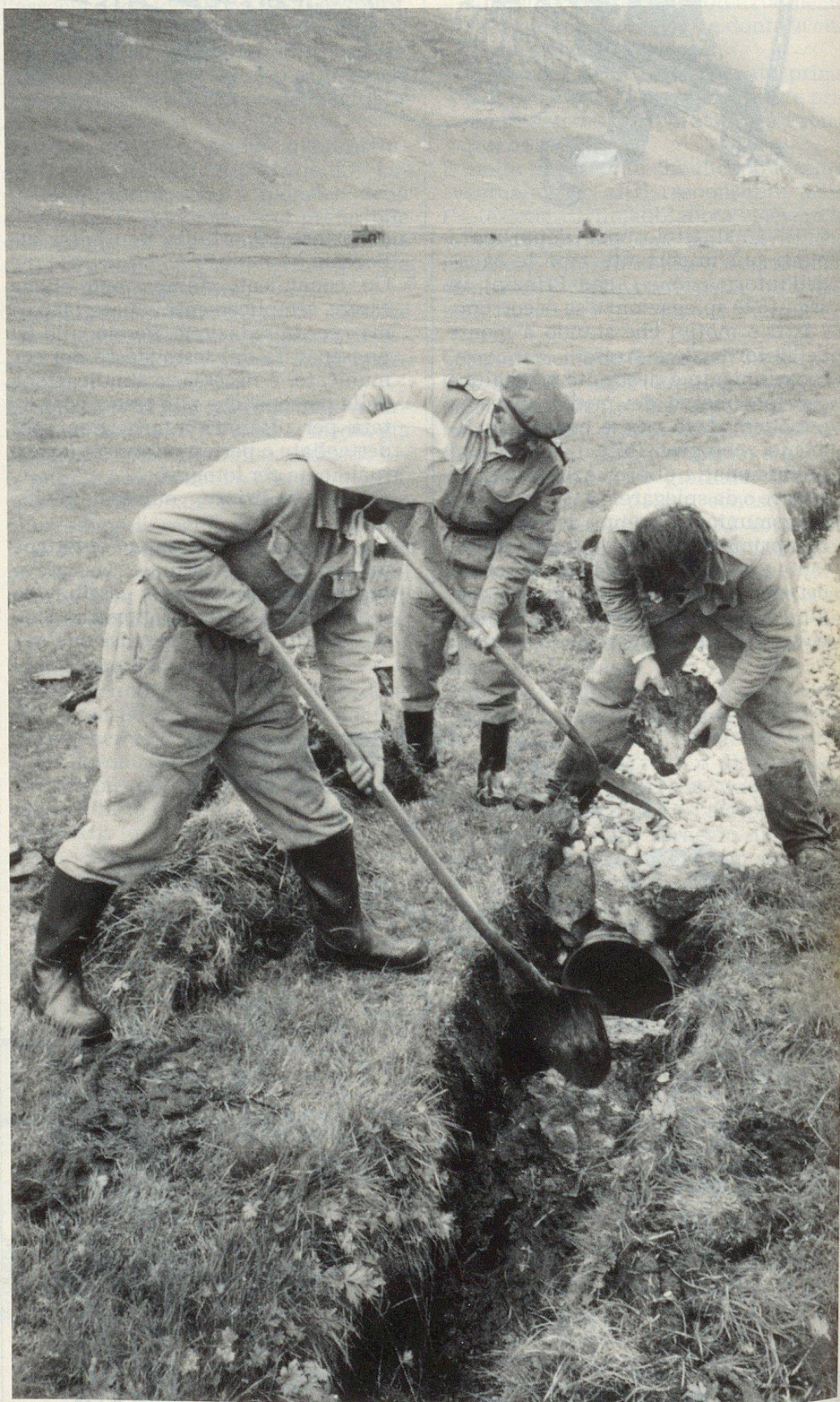
Zivilschutzdienstleistende aus Schötz im Kanton Luzern helfen – wie bereits letztes Jahr – im Urnerland die Spuren des Unwetters vom 24./25. August 1987 zu beseitigen. Hier eine Gruppe bei der Rekultivierung des Geländes in der Gemeinde Hospental.

Die ZSO-Leitung gibt die einzustellenden Frequenzen/Kanäle für den UKW- und Mittelwellenempfang bekannt. Diese sind auf dem Gerät zu markieren. Möglicherweise weichen diese Frequenzen von den heute üblichen ab.