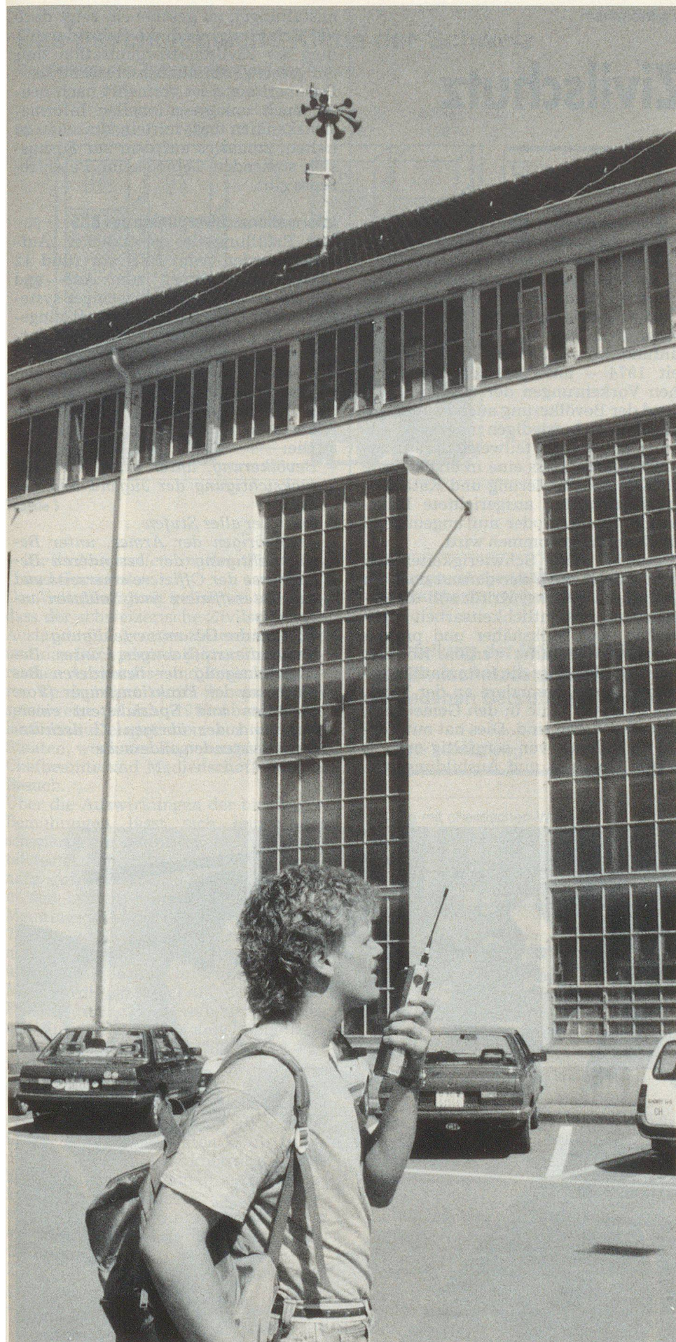
Gli impianti di sirene nella zona 1 sono sottoposti a manutenzione da specialisti e controllati nella loro efficienza perfetta. Ecco l'impianto di sirena presso la centrale idroelettrica di Beznau.