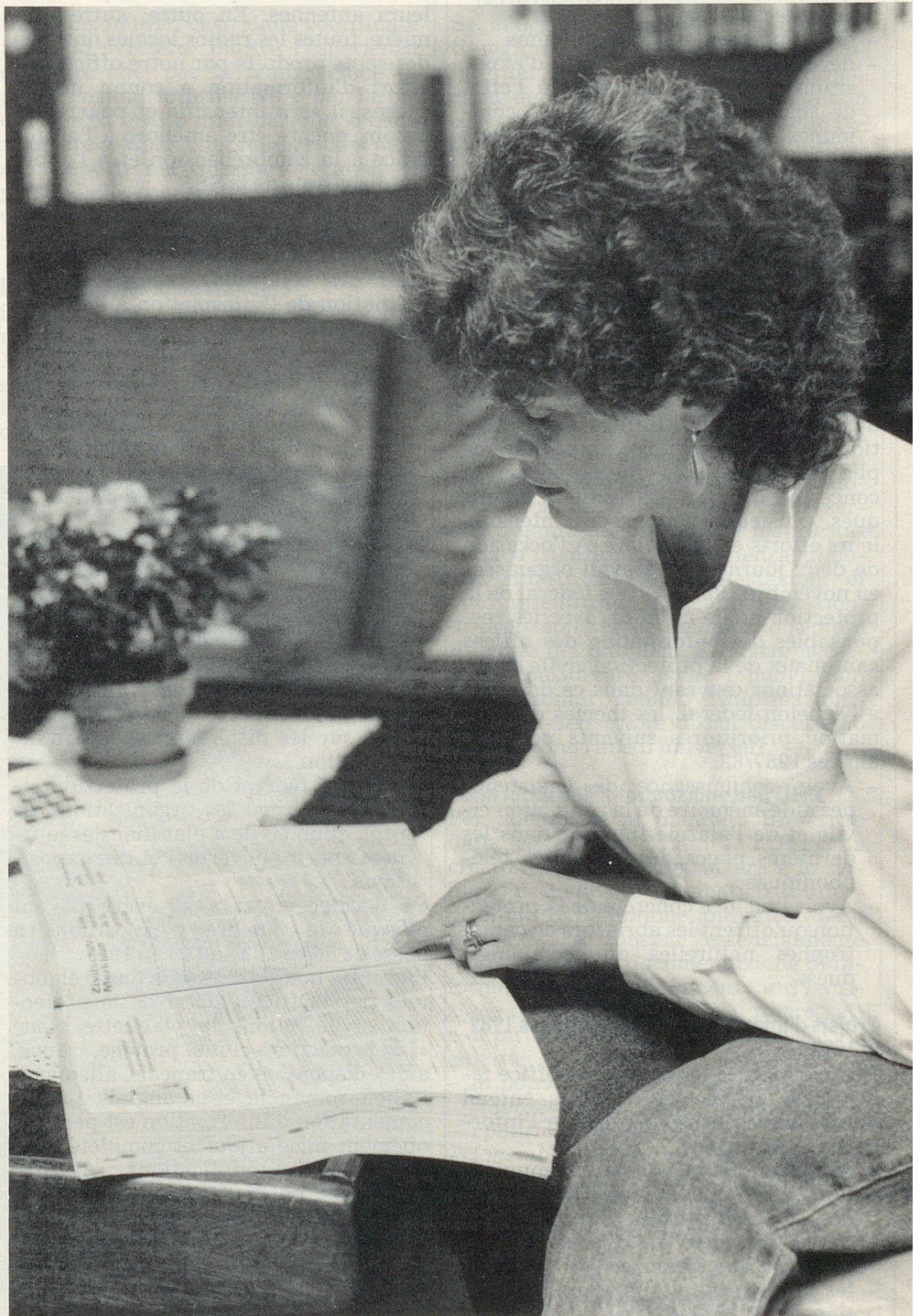
Les dernières pages de l'annuaire téléphonique.