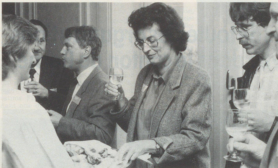
Nach der Arbeit das Vergnügen, meinen die Mitarbeiter des kantonalbernerischen Zivilschutzamtes und greifen von Herzen zu beim Aperitif.

auch über hundert Zivilschutzorganisationen in mehr als 20000 Dienstleistungstagen Nothilfe geleistet. In den 412 Gemeinden des Kantons Bern wurde auch in den Augen des Vorstehers des Kantonalen Zivilschutzamtes ein beachtlicher Stand vom «Zivilschutz-Soll» erreicht. Unter anderem könnten der Bevölkerung die Schutzplätze bis Ende 1989 zugewiesen werden. 1,14 Mrd. Franken seien im Kanton Bern bis heute in Zivilschutzbauten investiert worden.