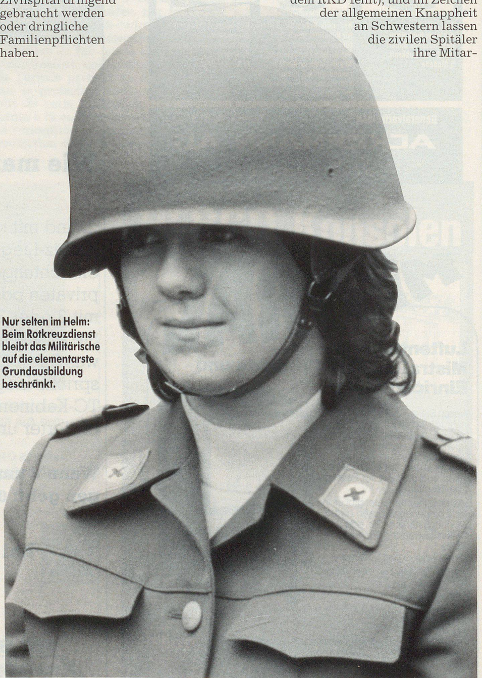
Nur selten im Helm: Beim Rotkreuzdienst bleibt das Militärische auf die elementarste Grundausbildung beschränkt.