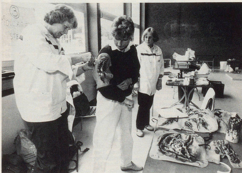
Samariterinnen beim Moulagieren. Die Bilder stammen aus der KSD-Übung Föhnsturm vom Mai 1987. Samariter waren daneben auch als Hilfspersonal in einem Basisspital sowie als Figuranten im Einsatz.