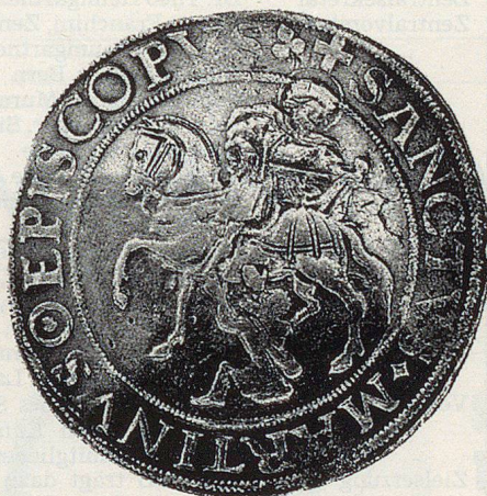
St. Martin als Sujet auf einer Münze.

In ländlichen Gegenden ersetzen ständige Samariterposten oft fehlende ärztliche Versorgung. Rund 600 Samaritervereine führen mindestens einen ständigen Samariterposten. Auch hier sind es die Innerschweizer Vereine, die das dichteste Netz unterhalten.