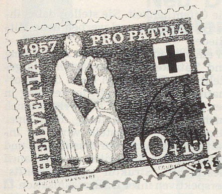
Samariterbildnis auf Briefmarken.

geben will. Dieser Kurs ist der erste Schritt zu einer Angebotspalette mit neuen Kursen, die sich an bestimmte Bevölkerungsgruppen richten. Gegenwärtig erarbeitet der Samariterbund einen Kurs, der speziell auf die Bedürfnisse der Senioren ausgerichtet ist. Zusammen mit dem SRK veranstalten die Samaritervereine seit jeher auch Kurse in der häuslichen Krankenpflege.