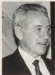
Hans Mumenthaler Direktor des Bundesamtes für Zivilschutz

meinheit hintanzustellen. Oft fehlt es im privaten oder beruflichen Umfeld am nötigen Verständnis für die mit der Übernahme einer Kaderstelle in einer Zivilschutzorganisation verbundene zusätzliche zeitliche Beanspruchung. Es ist symptomatisch für unsere Zeit und unsere Wohlstandsgesellschaft, dass das Gemeininteresse gegenüber den privaten Interessen jedes einzelnen weit hinten anstehen muss.