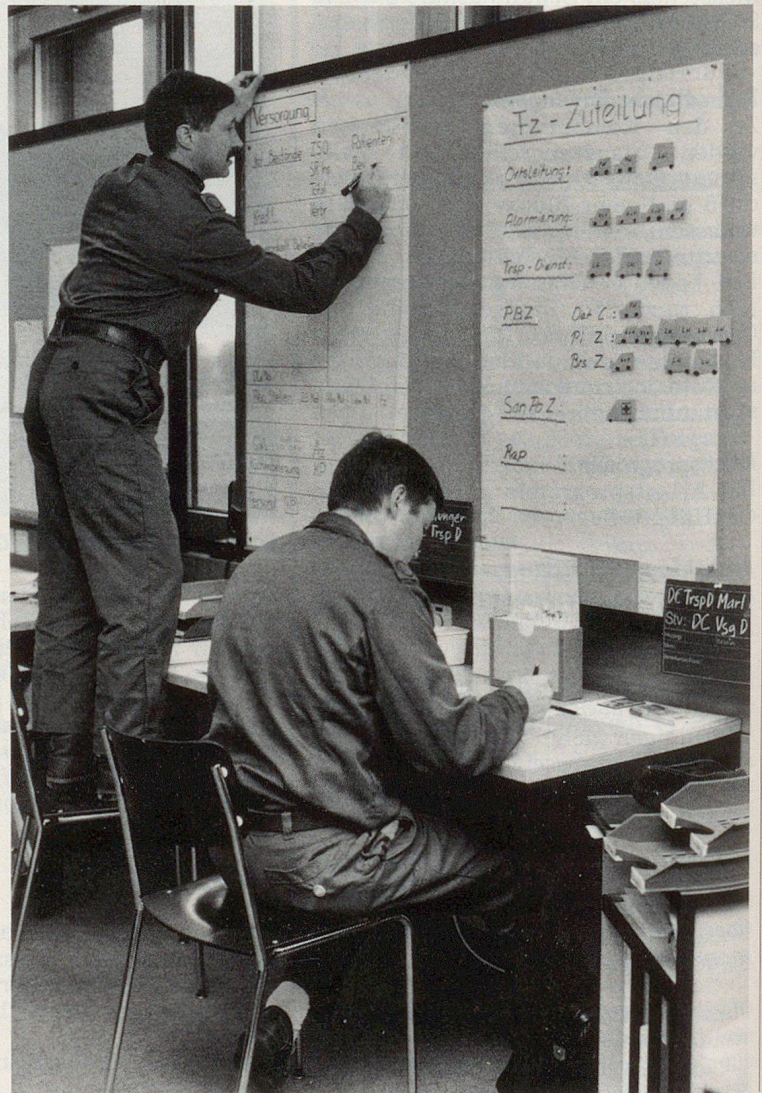
Deux chefs de service en pleine action.

Sont admis aux cours d'état-major combinés les états-majors de direction locale des organisations de protection civile qui comportent cinq îlots ou quartiers et plus, ainsi que les états-majors des directions d'arrondissement ou de secteur.