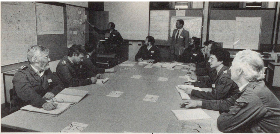
En haute: Attention soutenue pour le rapport d'état-major.