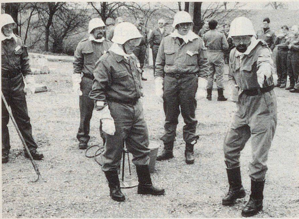
Klare Anordnungen für den späteren Einsatz: Der Zivilschutz soll von der Führungserfahrung von Offizieren profitieren.