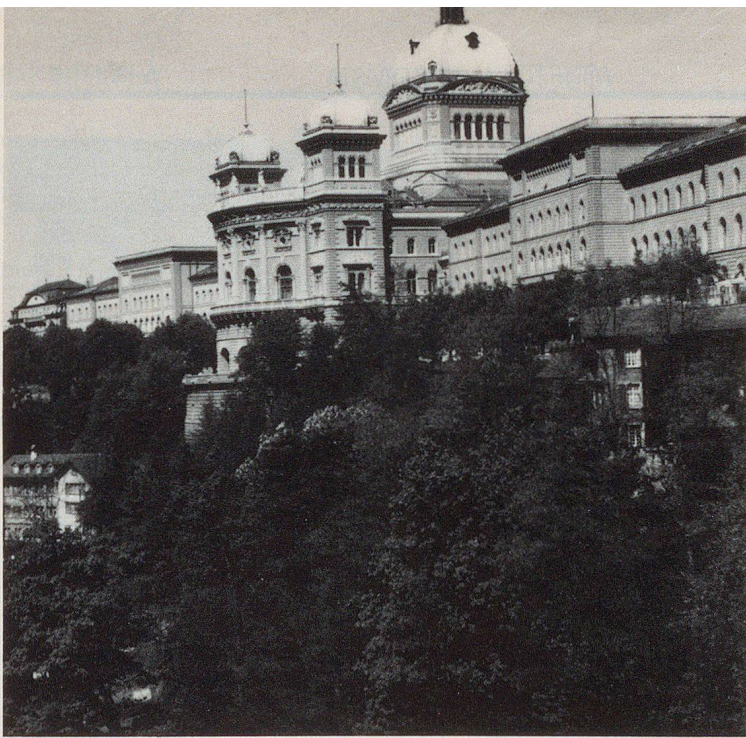
Das Bundeshaus, als Baudenkmal wie als Symbol, ist in höchstem Masse schützenswert.