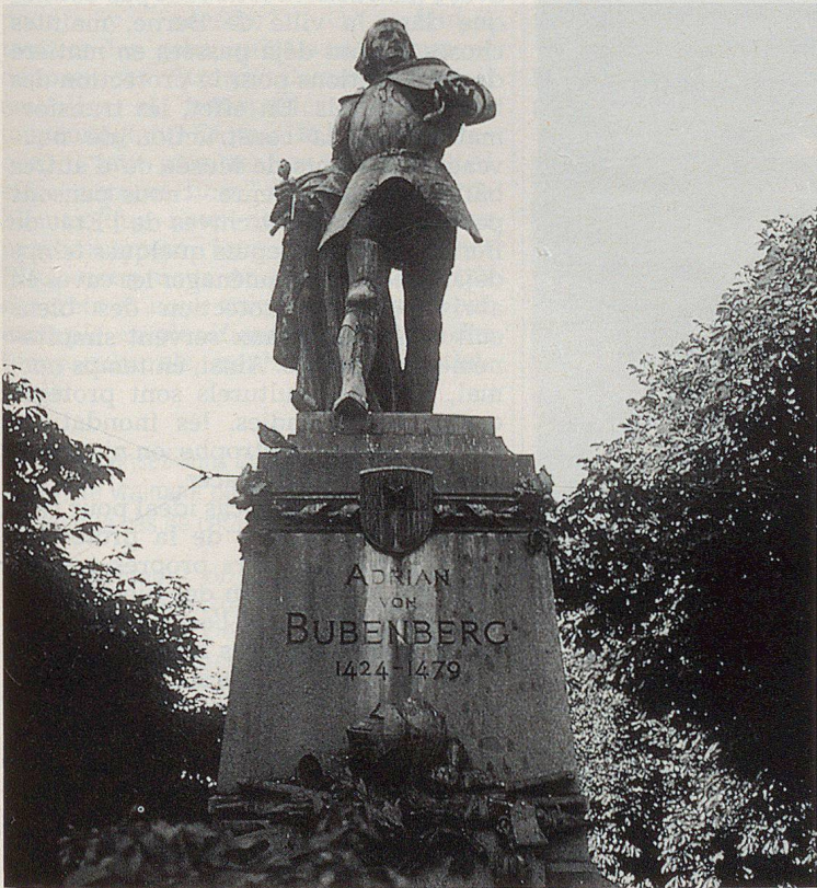
Ein Kulturdenkmal par excellence: das Bubenberg-Denkmal

▲ Wie würde beispielsweise das Berner Münster geschützt?