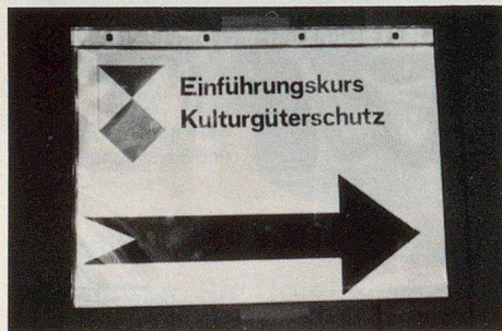
In Bern kommt der KGS jetzt ins Rollen – das Kurswesen ist schon perfekt organisiert.