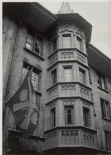
Wo historische Bausubstanz dominiert, herrscht ein grosser Mangel an Kulturgüterschutzräumen.