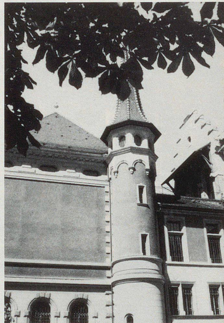
Bis unters Dach mit beweglichem Kulturgut gefüllt: Das Berner Historische Museum soll in einigen Jahren seinen Kulturgüterschutzraum bekommen.